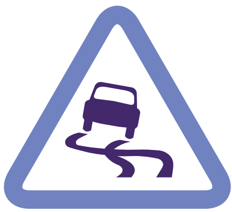
RÉGIME OUVERT : « GARDER LE CAP »