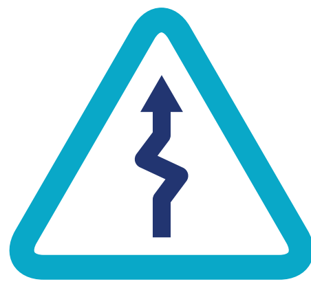
RÉGIME FERMÉ : « CORRECTION DE TRAJECTOIRE »